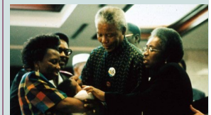
Nelson Mandela. Nosso aliado na Erradicação da Pólio no mundo. Foi uma grande honra trabalhar com ele.