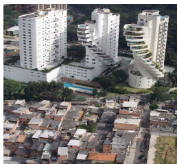
Favela de Paraisópolis.

O Rotary Club de São Paulo Morumbi é parte integrante do Distrito 4610, de Rotary International, mais conhecido apenas como Rotary Morumbi, é um clube de profissionais e empresários que atua na região que leva o seu nome e abriga mais de 100 comunidades carentes.